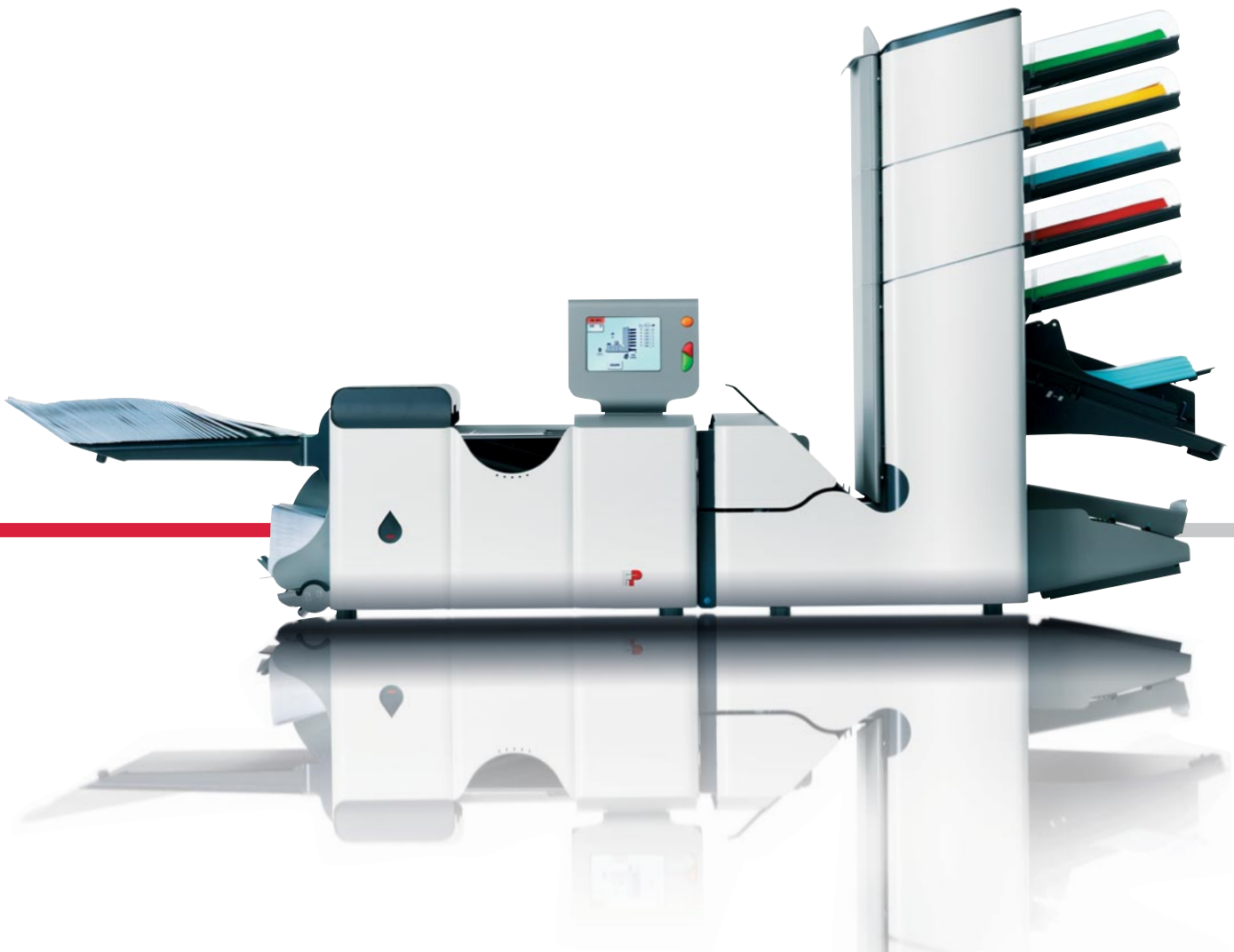
Kuvertiersystem FPI 5500

Flexibles Hochleistungssystem für Ihre Postbearbeitung.